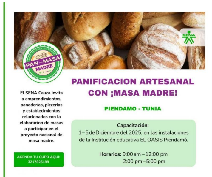
Ilustración 1. Poster realizado para hacer la divulgación del proyecto en el municipio de Piendamó, Cauca.